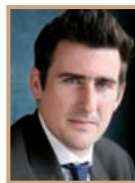
James Hilton Credit Suisse